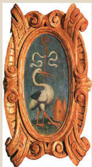
Monastero di Chiaravalle